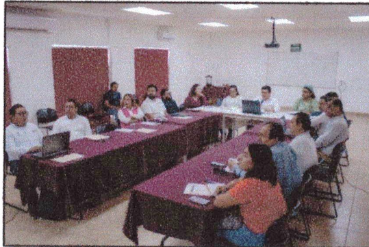
Foto 1.- Reunión de coordinación.

Personas participantes: 13 personas servidoras públicas (6 mujeres y 7 hombres).