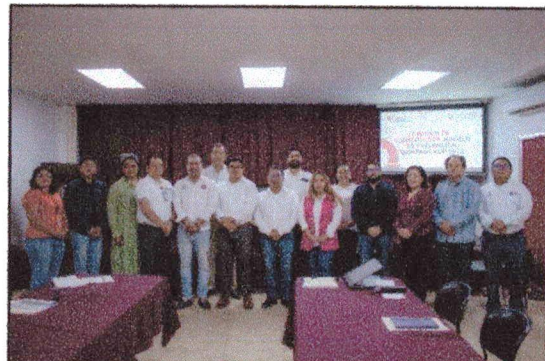
Foto 2.- Reunión de coordinación.