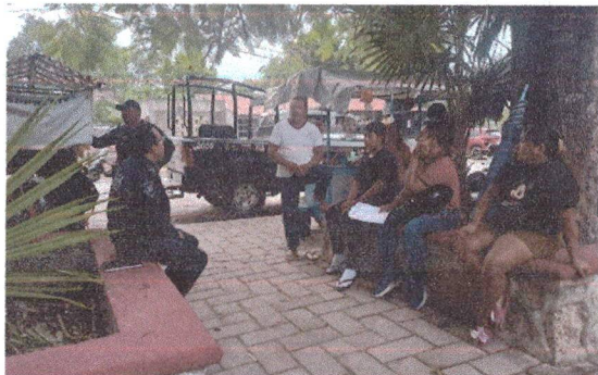
Foto 1.- Impartición de plática.

Beneficiarios: 6 personas del grupo ciudadano (2 mujeres y 4 hombres).