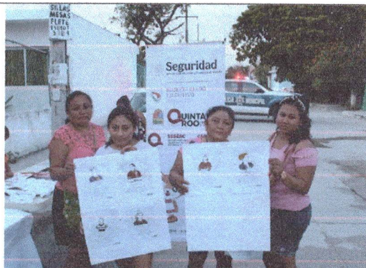
Foto 4.- Actividad cultural.