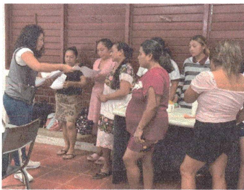
Foto 1.- Taller participativo.

Beneficiarios: 12 mujeres del grupo ciudadano.