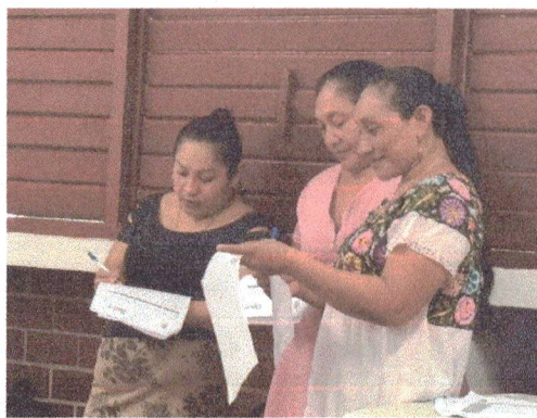
Foto 2.- Taller participativo.

2.- Actividad: Pláticas, actividad deportiva y cultural.