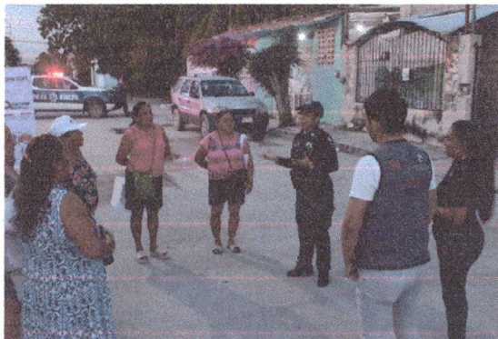
Foto 1.- Impartición de plática.

Beneficiarios: 14 mujeres del grupo ciudadano.