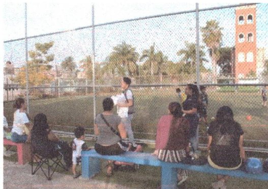
Foto 2.- Impartición de plática.