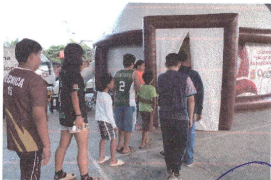
Foto 1.- Proyección de video.

Personas beneficiadas: 97 personas de la población en general (47 mujeres y 50 hombres).