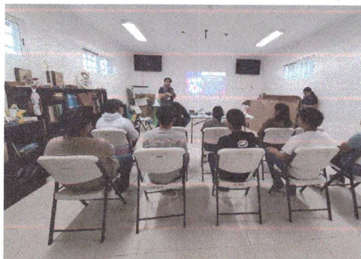
Foto 1.- Impartición de plática.

Personas beneficiadas: 10 personas (5 mujeres y 5 hombres).