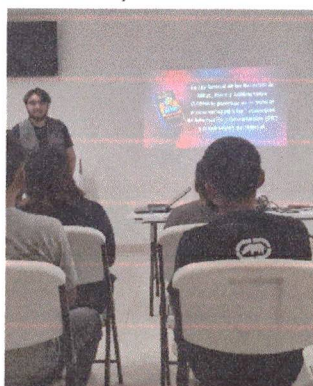
Foto 2.- Impartición de plática.